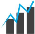
Growth Portfolio Create opportunity through growth

หุ้นที่มี Forward Yield สูงกว่า 4.50% และมี EPS Growth อยู่ในเกณฑ์ดี ประกอบกับระดับราคาปัจจุบันไม่สูงเกินไปเมื่อวัดจาก Forward P/B Ratio โดยจะคัดเลือกเฉพาะหุ้นที่จัดทำทวิเคราะห์ปัจจัยพื้นฐานเท่านั้น และมีการปรับพอร์ตทุกเดือนในช่วงกลางเดือน