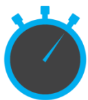
Trading Portfolio Play with market trend

เหมาะกับผู้ลงทุนที่มีความรู้และประสบการณ์ในการลงทุนมากพอสมควร เน้นลงทุนในหุ้นที่มีโอกาสปรับตัวขึ้นสูงและมีพื้นฐานดีเมื่อวิเคราะห์ตามหลักสถิติประกอบการวิเคราะห์ทางเทคนิค โดยที่พอร์ตจะปรับความเสี่ยงให้เข้ากับสภาวะตลาดในแต่ละช่วง